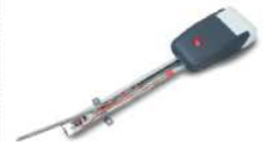
Motore a traino per FREEBOX Full motor for FREEBOX

novità Dr-Control Semplice. Pratico. Moderno.