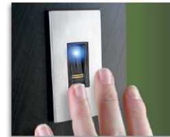
Letture di impronta digitale Fingerprint reader