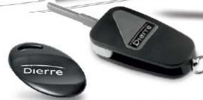
Key Control e Key Card