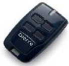
Telecomando BFT DIERRE BFT DIERRE remote control